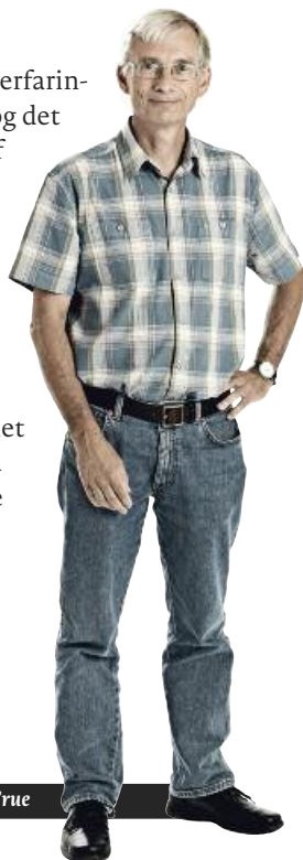
Af Jakob Sølvhøj, sektorformand